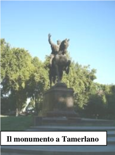
Il monumento a Tamerlano

La città è molto gradevole, con larghi viali alberati, una animatissima e vasta via pedonale, ricca di locali e ristoranti, ribattezzata familiarmente Broadway, larghe piazze con verdi giardini. Questo aspetto – in gran parte merito della amministrazione Sovietica – contrasta singolarmente con il relativamente piccolo centro storico, che conserva un aspetto di villaggio asiatico, con case basse, una planimetria incerta e la madrasa come punto di riferimento.