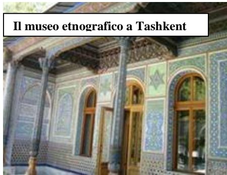
Il museo etnografico a Tashkent